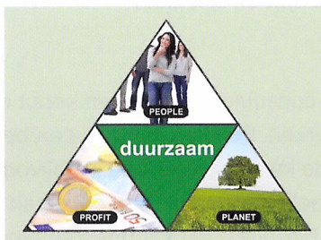
Afb. 1.17 In een duurzame wereld zijn mens (people), milieu (planet) en economie (profit) met elkaar in evenwicht.