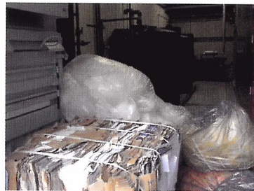
Afb. 1.26 Scheid het afval.