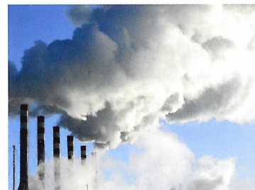
Afb. 1.18 Een fabriek die veel vuil uitstoot, belast het milieu en produceert niet duurzaam.