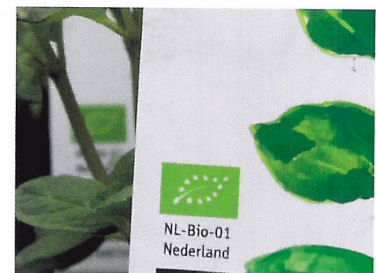
Afb. 1.27 Biologisch geteelde planten herken je aan het keurmerk.

1.10 Wat is een voorbeeld van een duurzaam product in de groene sector?