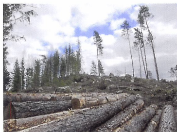
Afb. 1.16 Door een bos te kappen en geen nieuwe bomen terug te planten, maak je de aarde kapot. Je pleegt roofbouw op de aarde.

Iets wat duurzaam is, gaat lang mee en kan hergebruikt worden. De productie en het gebruik ervan houden rekening met toekomstige generaties. Bij de productie en het gebruik wordt gestreefd om verstandig om te gaan met het milieu, met energiebronnen en met de mens. Er wordt niets kapotgemaakt op de aarde. Duurzaamheid is hierdoor vaak milieuvriendelijk. Het is niet altijd even gemakkelijk om te bepalen of iets duurzaam is. Aluminium bijvoorbeeld kan jaren mee voordat het versleten is. Maar bij de productie van aluminium wordt het milieu erg verontreinigd. Dus is aluminium niet duurzaam. Je moet dus naar productie én gebruik kijken voor je weet of iets duurzaam is.