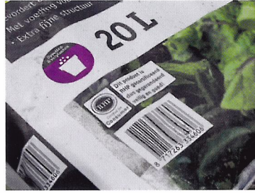
Afb. 1.23 Het RHP-keurmerk is een keurmerk voor duurzame potgrond. De herkomst van de grondstoffen is verantwoord.