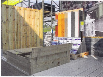
Afb. 1.25 Verkoop duurzaam FSC-hout.