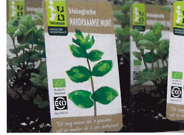
Afb. 1.24 Het Europees biologisch keurmerk maakt duidelijk dat het product voldoet aan de EU-regels voor biologische landbouw.