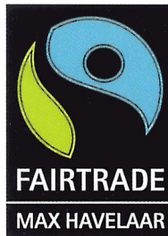
Afb. 1.20 Fair trade bevordert duurzame ontwikkeling van de handel, waarbij mensen goed behandeld worden en een juiste prijs voor hun producten krijgen.