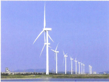
Afb. 1.19 Windmolens produceren energie uit wind. Dit is een alternatief voor minder duurzame energiebronnen als aardolie.