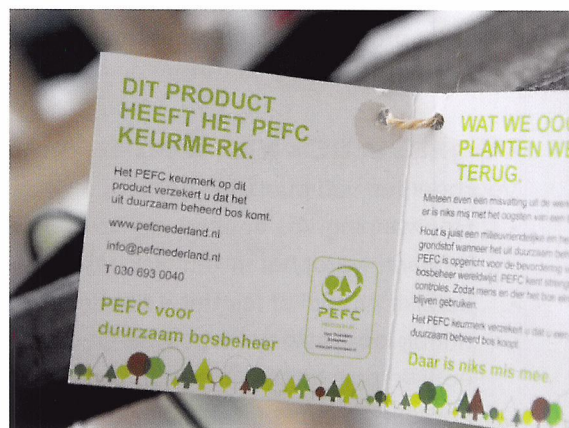
Afb. 1.15 Een keurmerk is een bewijs dat iets goedgekeurd is en de vereiste kwaliteit heeft.

Veel mensen praten over duurzaamheid. Duurzaam bouwen, duurzaam eten, duurzame kleding, duurzaam ondernemen. Maar wat betekent het eigenlijk? Je leert wat duurzaamheid is en waaraan je duurzame producten kunt herkennen. Als je weet wat duurzame producten zijn, kun je klanten adviseren en hen het verschil tussen duurzame en reguliere producten uitleggen.